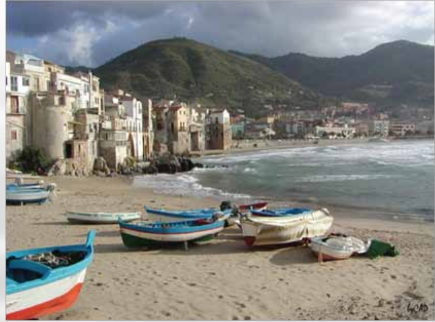
Gradska plaža u mestu Cefalu.

Južno od grada, u planinskim predelima je Parco delle Madonie , nacionalni park površine 40.000 ha gde se nalaze oko 15 gradova i sela koji su u srednjem veku bili plemićki posedi. Ovi skriveni planinski predeli sa najvišim vrhom od skoro 2000 m i prelepa priroda otkriće nam i drugo lice Sicilije koje se znatno razlikuje od onog koje smo videli u primorskim mestima.