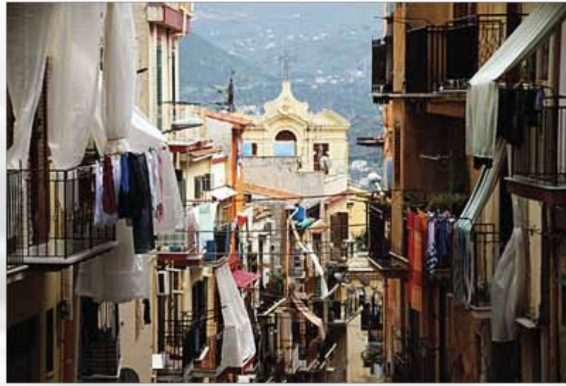
Tipična sicilijanska uličica u Palermu

Pošto smo već imali prilike da se nagledamo raznih istorijskih građevina u Palermu nas čeka nešto drugačije što je u najvećoj suprotnosti sa živim temperamentom građana – katakombe kapućinskog manastira iz 17.veka.