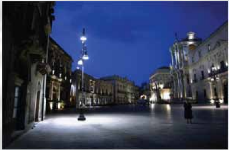
Piazza Duomo, na ostrvcetu Ortygia, trg ovekovečen u filmu Malena.