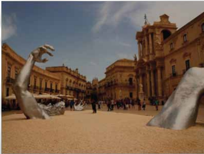
Siracusa je Arhimedov rodni grad

Prvi grad koji ćemo posetiti na Siciliji biće Siracusa, čija istorija traje već 2.700 godina. Zbog mnogih kulturnih spomenika grad je na UNESCO-voj listi. Siracusa je poznata po dobrom provodu i odličnim restoranima i barovima.