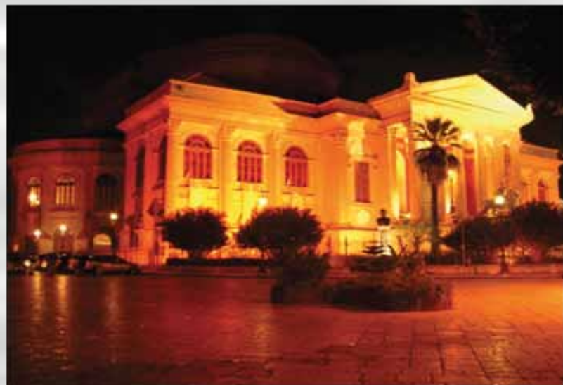
Teatro Massimo, najveće pozorište u Italiji