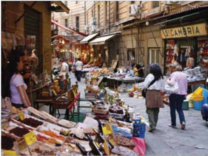
Pijaca Vucciria, jedna od nekoliko u gradu.

Ono što Palermu posebno daje draž su njegovi stanovnici. Grad je živ bez obzira na doba dana ili noći.