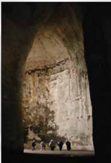
Pećina Dionisovo uvo, čuvena po akustici