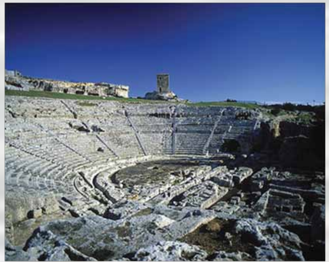
Grčko pozorište, najveće na Siciliji, primalo je 16.000 ljudi