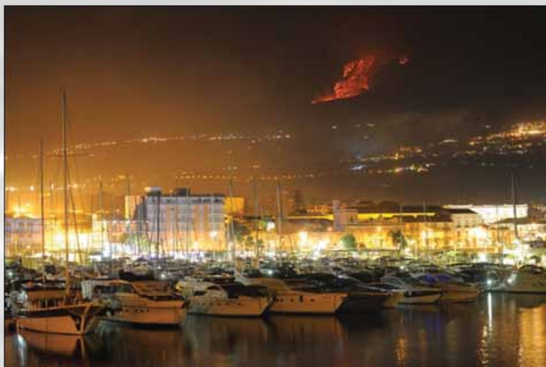
Marina u Ripostu, u pozadini vulkan Etna