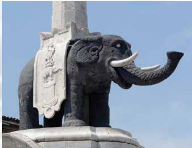
Simbol grada, fontana od lave

Sledeća marina nam je u mestu Riposto, sa pogledom na Etnu. Ovde ćemo se malo odmoriti od razgledanja i videti kako žive meštani van turističkih mesta.