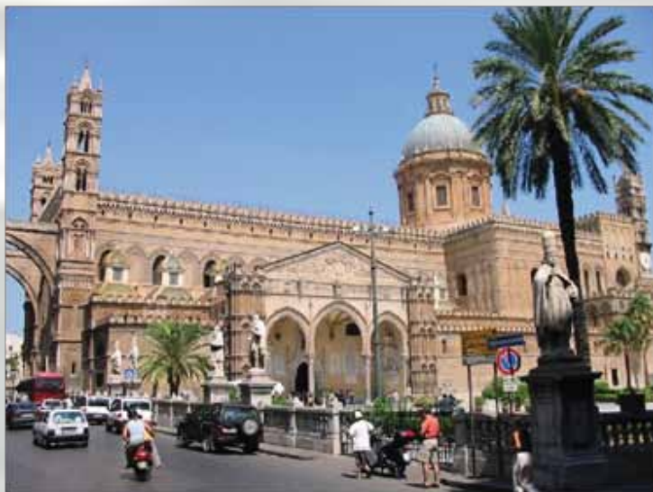
Katedrala u Palermu, mešavina raznih stilova

Palermo je grad kontrasta – bogate istorije i kulture, prelepih trgova i siromašnih, prljavih kvartova, veselih, ljubaznih građana i prestonica sicilijanske mafije. On je sigurno i mnogo više od toga, ali to ćemo morati sami da otkrijemo.