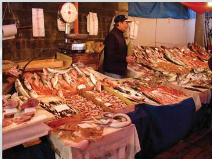
Riblja pijaca u Ripostu

Sledeća marina nam je u mestu Riposto, sa pogledom na Etnu. Ovde ćemo se malo odmoriti od razgledanja i videti kako žive meštani van turističkih mesta.